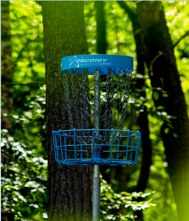
ነፍሲ ወከፍ ነኳል ዝዕጸው እቲ ዲስክ ኣብቲ ሓጻኖዊ ሰኪዐት ምስ ዝዓልብ እዩ።